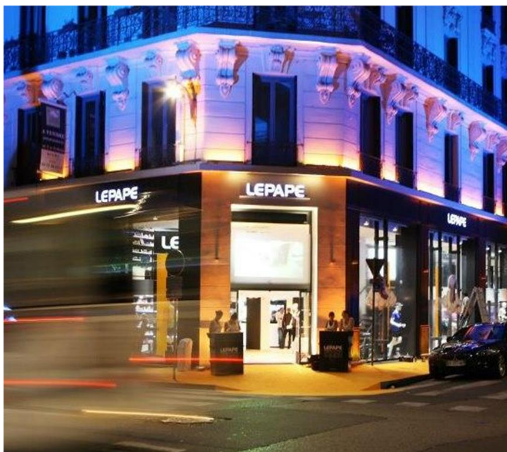
Photo : LEPAPE STORE LYON, 9 rue Grolée