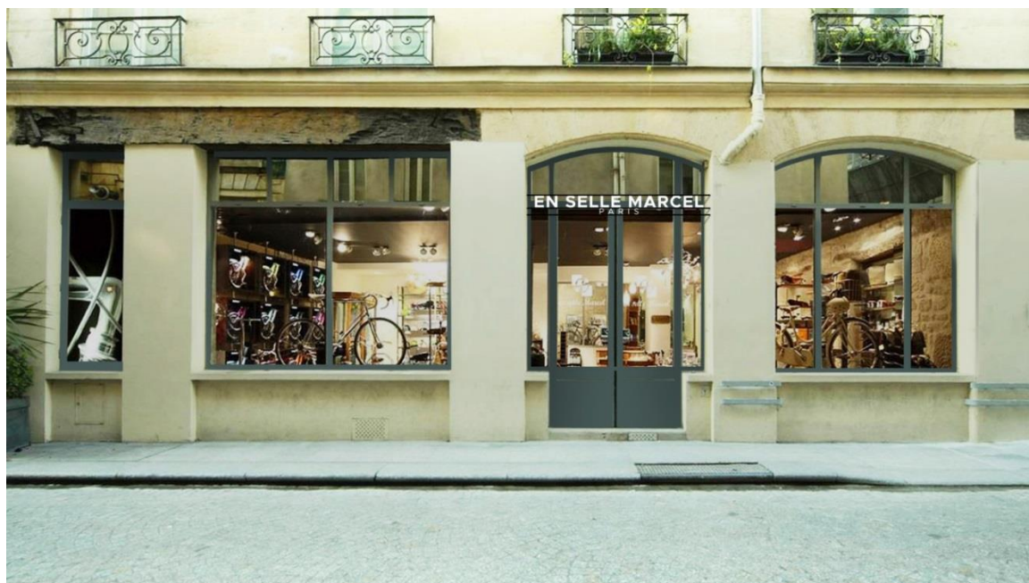
Photo : EN SELLE MARCEL PARIS, 40 rue Tiquetonne